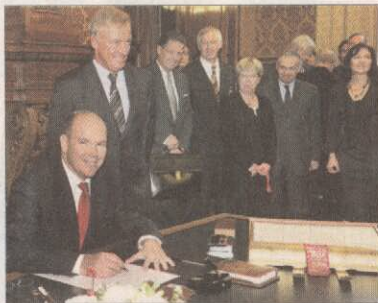
Eintrag ins Goldene Buch, mit Bürgermeister Ole von Beust.

Das 51-jährige Staatsoberhaupt war zur Verleihung des diesjährigen Umweltpreises des Bundesdeutschen Arbeitskreises für Umweltbewusstes Management e.V. (B.A.U.M.) in die Hansestadt gereist. Schon um 13 Uhr standen die ersten Schaulustigen im leichten Nieselregen auf dem Rathausmarkt, um einen Blick auf den prominenten Gast zu erhaschen. Die rot-weiße Flagge Monacos wehte über dem Rathausportal, als der Fürst pünktlich, aber ohne seine Lebensgefährtin Charlene Wittstock (31) kurz vor 13.30 Uhr in einem schwarzen Mercedes vorgefahren wurde. Geduldig ließ er sich Bücher und Fotos reichen und signierte einige Minuten lang, bis er von Bürgermeister Ole von