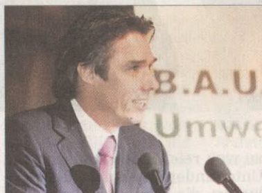
Michael Stich hielt die Laudatio auf Albert, mit dem er befreundet ist.

Beust auf der Senatstreppe in Empfang genommen wurde. Hier überraschte ihn ein Fotograf dann mit einem besonderen Foto: Er zog eine fast 40 Jahre alte Ansichtskarte der Fürstenfamilie aus der Tasche, die der damalige Fürst, Rainier III., und seine Gattin, Fürstin Gracia Patricia, Mitte der 70er-Jahre unterzeichnet hatten. Albert, zur Zeit der Aufnahme – ebenso wie seine Schwestern Caroline und Stéphanie – noch ein Kind, unterzeichnete sie nach einem langen Blick darauf.