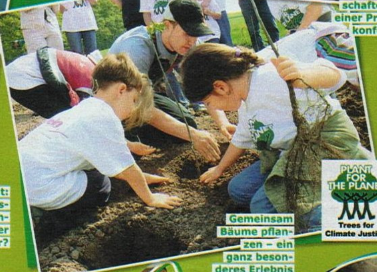
Gemeinsam Bäume pflanzen – ein ganz besonderes Erlebnis