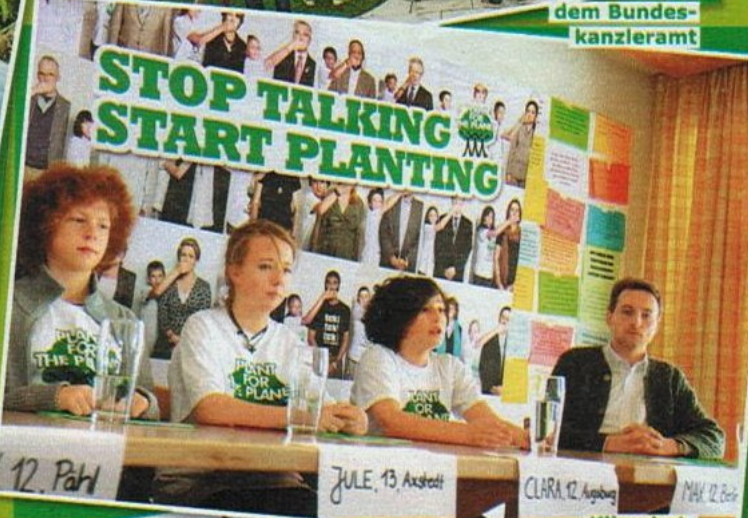
Klimabotschafter bei einer Pressekonferenz