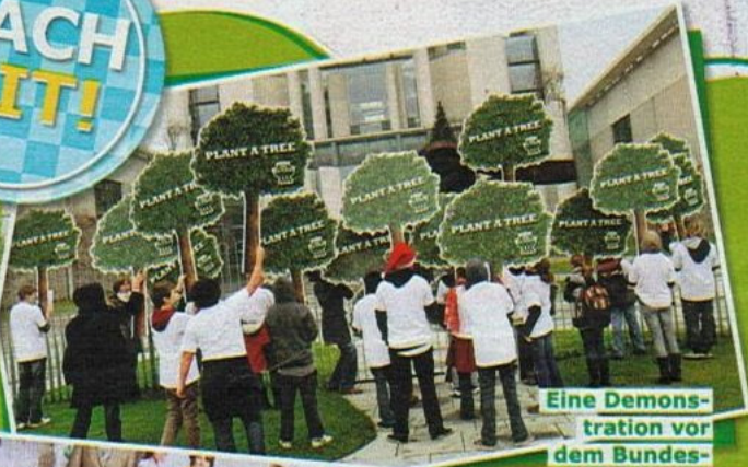
Eine Demonstration vor dem Bundeskanzleramt