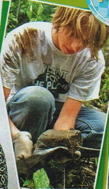
In den Akademien lernen die Teilnehmer, wie man Bäume pflanzt